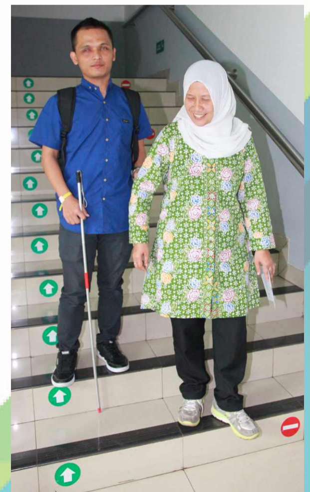
Orientasi Mobilitas Pendamping Awes Turun Tangga

Teknik berjalan dengan pendamping, meliputi teknik berjalan dengan pendamping dalam berbagai situasi dan lingkungan yang berbeda-beda.