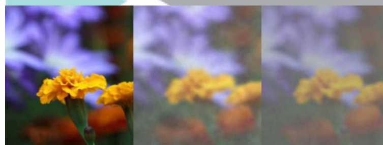
PENGLIHATAN NORMAL PENGLIHATAN KATARAK (Tahap Awal) PENGLIHATAN KATARAK (Tingkat Lanjut)